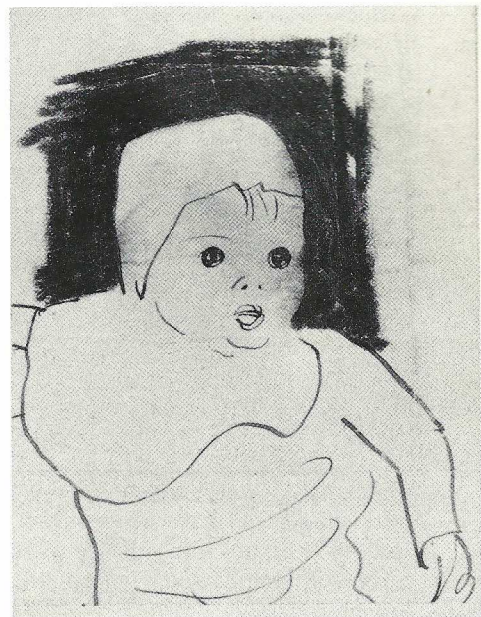
R egina (Regina Cassolo Bracchi): «La bimba», disegno a penna e matita su carta. Cm. 10 x cm. 7,5, datato sul verso: «3 maggio '21». (Collezione dell'Isisuf).